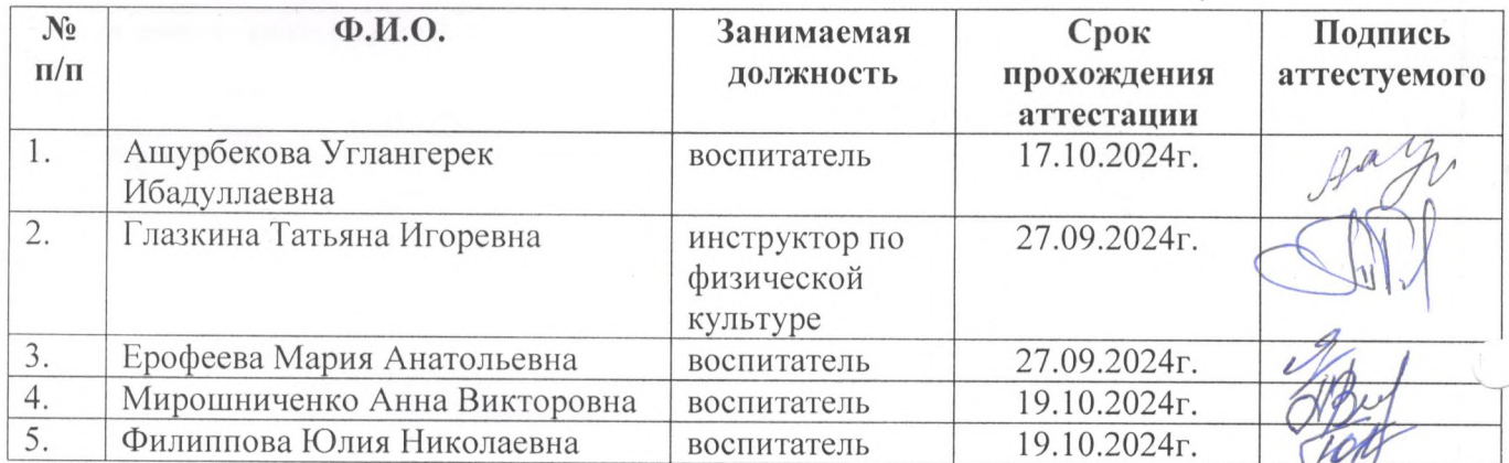
График прохождения аттестации с целью подтверждения соответствия занимаемой должности в 2024-2025 учебном году